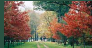
Distance depuis Camifolia : 13 km Coût : 5 €/pers. - Durée : 2h

Vieux, rares ou exotiques, les arbres du parc du château de Martreil vous feront voyager. Avec plus de cent espèces d'arbres réparties sur 35 hectares, ce très beau parc à l'anglaise saura séduire les âmes romantiques grâce à son bel étang et aux bois qui l'entourent.