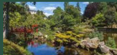
Distance depuis Camifolia : 30 km Coût : de 7 à 8 € / pers. selon visite Durée : 2h

Plus grand jardin japonais d'Europe, le parc vous surprendra par la richesse de sa végétation, son cadre architectural, la taille « à la japonaise » et la sérénité des lieux qui s'en dégage. Le site accueille également une exposition permanente de Bonsaï que vous pourrez découvrir après la visite guidée du site.