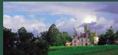
Distance depuis Camifolia : 14 km Coût : de 5 à 25 € / pers. selon visite Durée : de 1h30 à 3h selon visite

M. et Mme Giovannoni, viticulteurs, travaillent tout en bio et sont en cours de certification. Des éléments de biodynamie complètent également leurs pratiques telles que l'utilisation des plantes médicinales. Plusieurs visites sont proposées dans un esprit de convivialité.