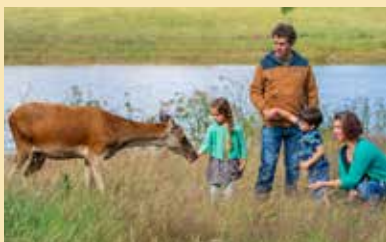
Distance depuis Camifolia : 13 km Coût : 6 à 35 €/pers. - Durée : 2h

Un restaurant propose également des menus élaborés avec les produits frais de la ferme et/ou issus de producteurs locaux.